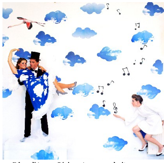
Rêve d'Anna, Série « A vos souhaits », 2010