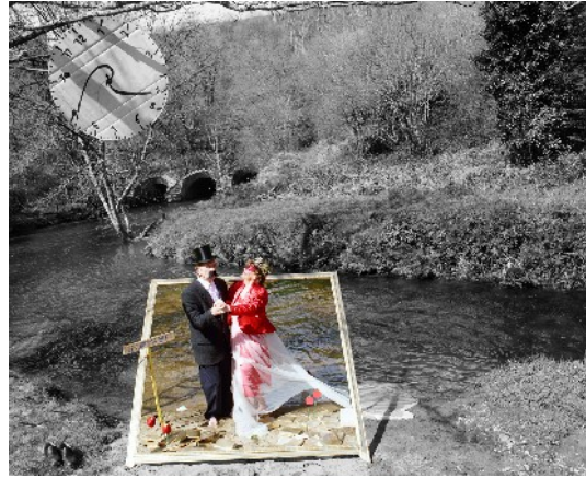
Les danseurs, série « Les réfugiés oniriques », 2008