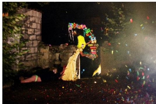
Série « La fête des songes », 2009