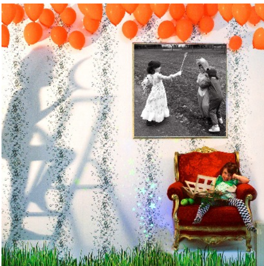
Rêve de Celia, Série « A vos souhaits », 2010