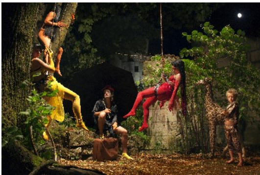
Série « La fête des songes », 2009