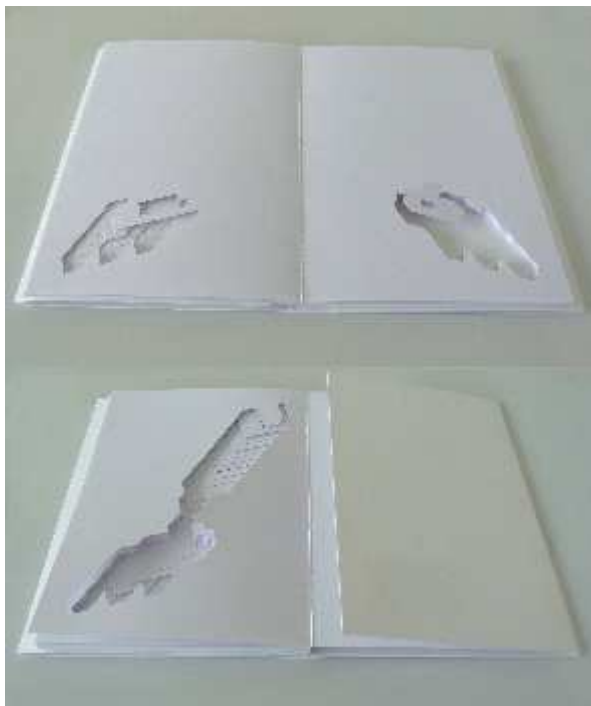
Percée , Livre 00109.001. Papier imprimé et troué, exemplaire unique, 15 x 21 x 1,5cm, 2008.