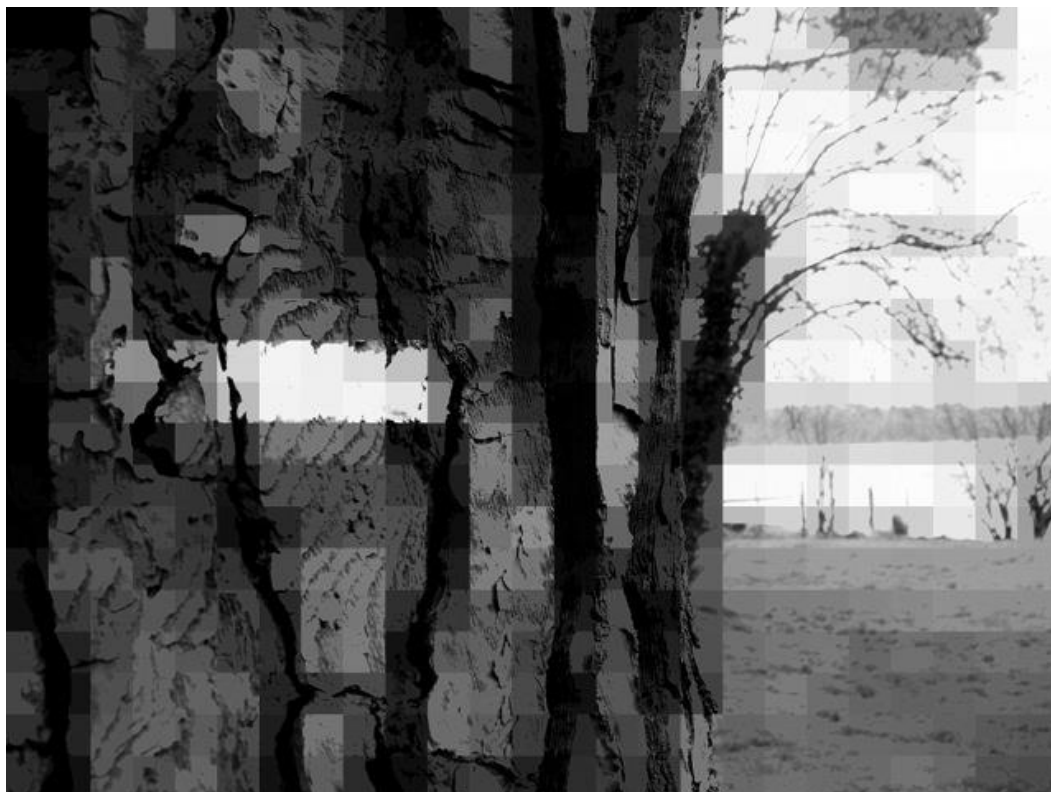
Philippe Lerestif, détail de l'installation photographique Paysages , 2014