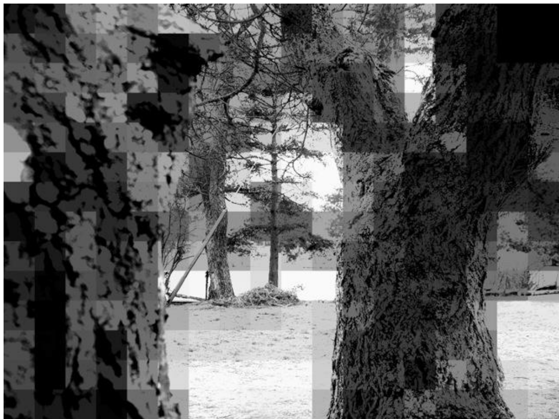
Philippe Lerestif, détail de l'installation photographique Paysages , 2014