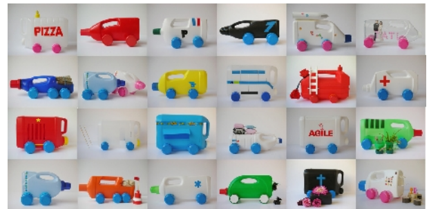
Martine Camillieri, Les Camions bidons .

27 flacons ménagers incitant à une écologie esthétique.