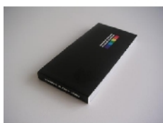
Exemple de Flip book