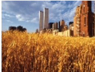
Agnes Denes, Wheatfield-a confrontation , 1982. Battery park City Landfill, New York. Blé semé et récolté, superficie 8000 m2.

Mercredi 6 juin à 18h Conférence de Véronique Boucheron, Le paysage, une fenêtre sur l'art contemporain Salle Juguet, Hôtel de Montfort Communauté, Montfort-sur-Meu