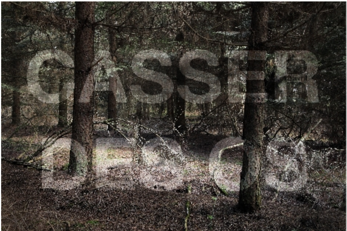
Lionel Pralus, Les bras à terre , série de photographies, 90 x 60, 2012.

L'aparté, lieu d'art contemporain du Pays de Montfort - http://www.laparte-lac.com/ Dossier de presse - mai 2012