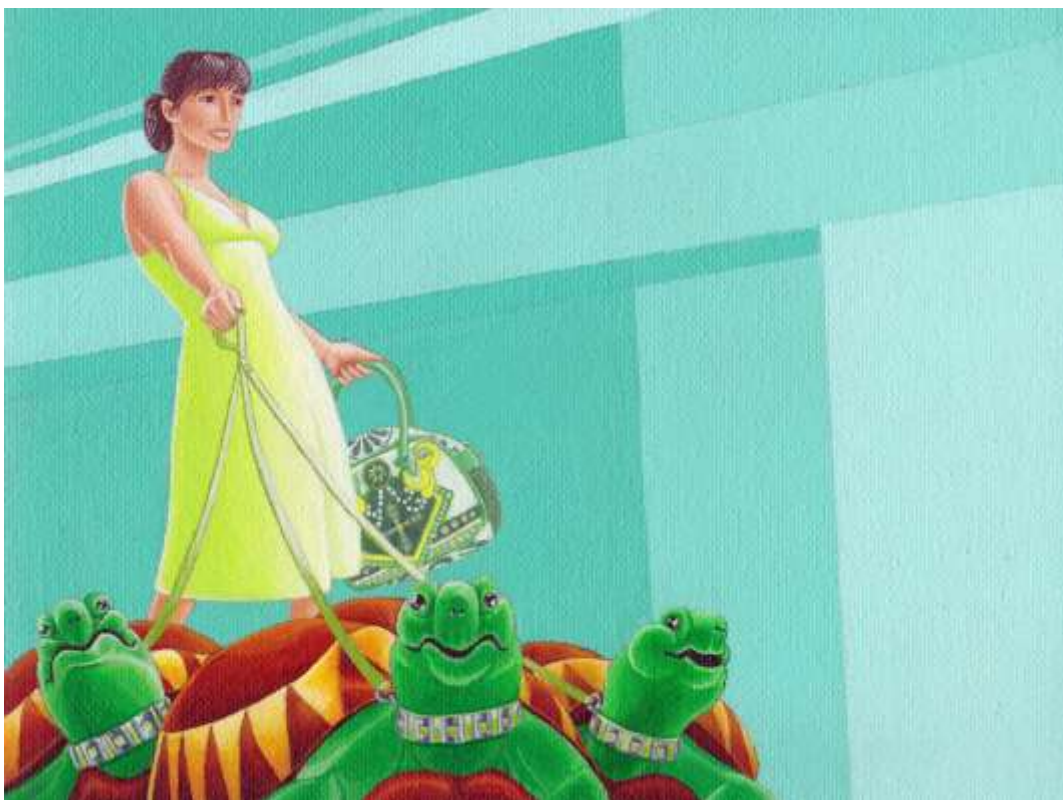
Thomas Tudoux, Insomnie (détail), peinture acrylique, 2014.