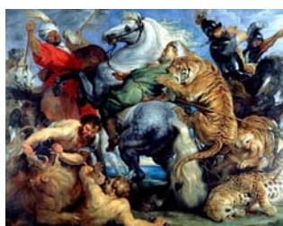
Pierre Paul Rubens, La chasse au tigre , 1615-1617, huile sur toile, 256,2 x 324,51 cm, Musée des Beaux-arts de Rennes.