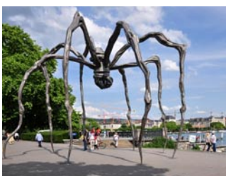
Louise Bourgeois, Maman , 1999, sculpture en bronze ou acier inoxydable, localisation multiple.