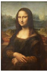
Léonard de Vinci, La Joconde , 1503-1506, huile sur toile, 77 x 53 cm, Musée du Louvre, Paris.

Vous trouverez ici le corpus des œuvres présentes dans la "Fiche Atelier" afin de pouvoir les réutiliser en classe dans le cadre de votre cycle "Histoire des arts".