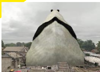
Di liu, animal regulation n°4 , 2010, photomontage, 80 x 60 cm.