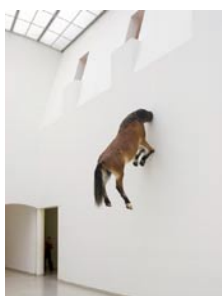
Maurizio Cattelan, Untitled , 2007, Cheval naturalisé, 300 x 170 x 80 cm.