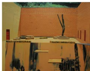
Gilles Aillaud, La fosse , 1999, Musée des Beaux-Arts de Rennes.