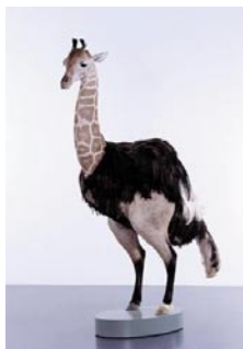
Thomas Grünfeld, Girafe , 2000 animal naturalisé, 13 x 21 x 8 cm.