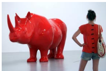
Xavier Veilhan, The Rhinoceros , 1999, résine polyester, peinture, 170 x 140 x 415 cm, Centre Pompidou, Paris.