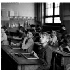
Robert Doisneau, L'information scolaire , 1956, photographie, L'atelier Robert Doisneau, Montrouge.