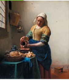
Johannes Vermeer, La laitière , 1657-58, huile sur toile, 24 x 21 cm, Rijksmuseum Amsterdam