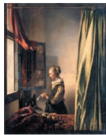
Johannes Vermeer, La liseuse , 1657, huile sur toile, 83 x 64,5 cm, Gemäldegalerie, Dresde.