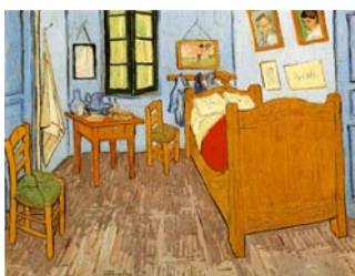
Vincent Van Gogh, La chambre de Van Gogh à Arles , 1888, peinture à l'huile, 72 x 90 cm, Musée Van Gogh, Amsterdam.