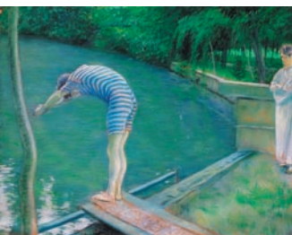
Gustave Caillebotte, Le plongeur , 1848-1894, pastel, Musée d'Agen.