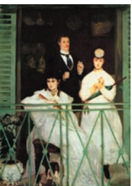
Édouard Manet, Le balcon , 1868, Musée d'Orsay.