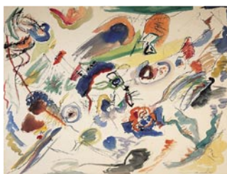
Vassily Kandinsky, Aquarelle abstraite , 1910, aquarelle, Musée d'art moderne, Paris.

Vous trouverez ici le corpus des œuvres présentes dans la "Fiche Atelier" afin de pouvoir les réutiliser en classe dans le cadre de votre cycle "Histoire des arts".