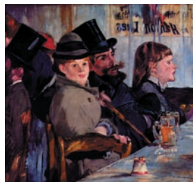
Edouard Manet, Au café , 1878, huile sur toile, collection particulière.