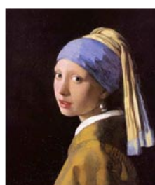
Johannes Vermeer, La jeune fille à la perle , 1665, 44 x 39 cm, Mauritshuis.