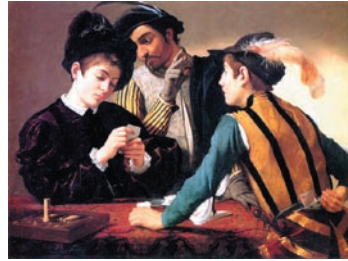
Le Caravage, Les tricheurs , 1594, peinture à l'huile, Kimbell Art Museum.