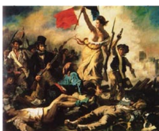
Eugène Delacroix, La Liberté guidant le peuple , 1830, 260 x 320 cm, Musée du Louvre-Lens.