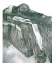
Hélène Muheim, Emma , 2012, poudre de graphite sur papier, ombres à paupière, 100 x 70 cm, galerie Maia Muller, Paris.