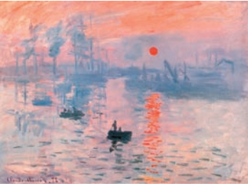
Claude Monet, Impression soleil levant , 1872-73, huile sur toile, Musée Marmottan Monet.