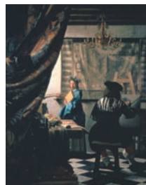
Johannes Vermeer, L'atelier du peintre , 1665, huile sur toile 130 x 110 cm, Kunsthistorisches Museum, Vienne.