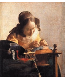
Johannes Vermeer, La dentellière , 1669-70, huile sur toile, 24 x 21 cm, Musée du Louvre.