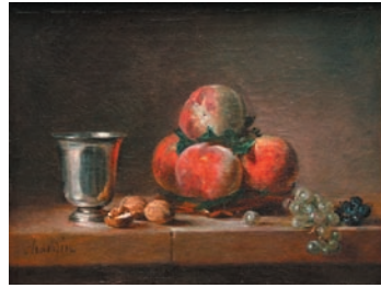
Jean Siméon Chardin, Nature morte aux pêches , 1760, huile sur toile, J. Paul Getty Museum.