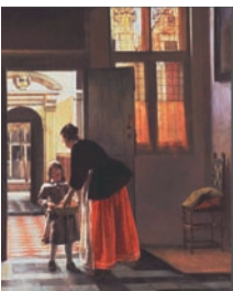
Pieter de HOOCH, Jeune garçon apportant des grenades , 1663, huile sur toile, Wallace Collection, Londres.