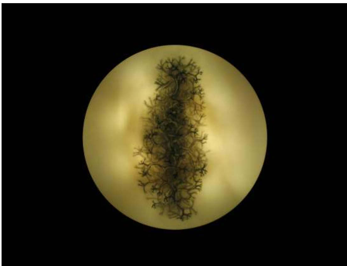
Eunji Peignard-Kim, Cyclopes , 2015