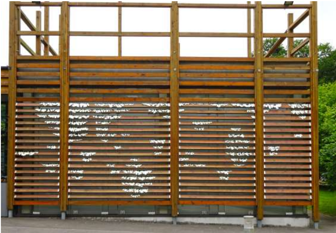
Eunji Peignard-Kim, Drapés de paysage (détail) , 2015