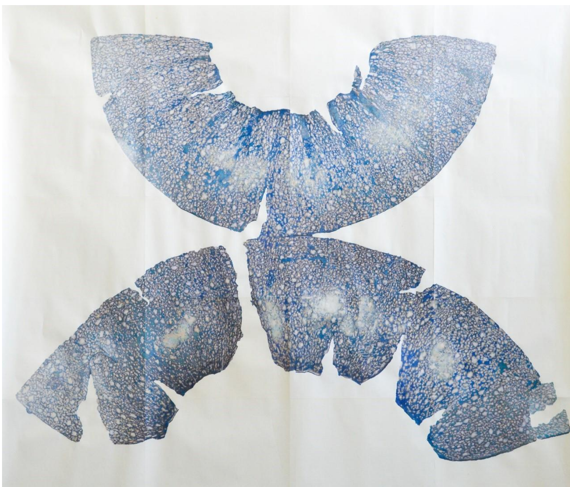
Les Mundis - Cucurbita , eau, encre, impression jet d'encre sur papier, 205 x 120cm, 2017.