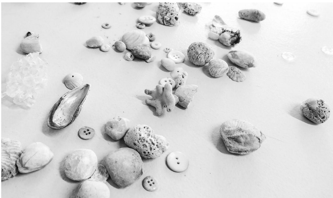
Mermère , 2018. Réalisation en cours.