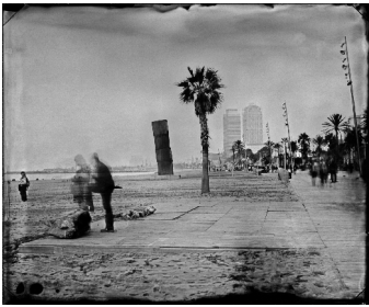
Israel Ariño / Atelieretaguardia, Barcelone 2010

Conférence le vendredi 28 septembre 2012 à 19h au Centre culturel Pôle Sud, Chartres de Bretagne : « Le collodion humide – Historique du procédé » par le photographe Israel Ariño