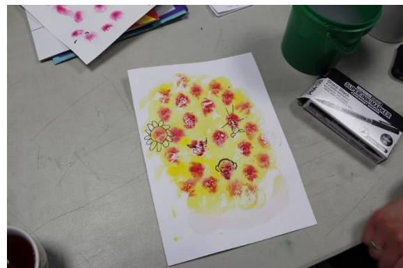
Atelier à la gouache diluée, tampons et crayon