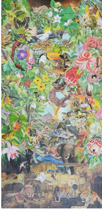
Sir John Soane's Museum , 2020. Illustrations découpées et collées sur papier, 87,1 x 43,1 cm

composés de professionnels de la Petite Enfance et de la Culture afin de confronter les points de vue, leur connaissance du public 0-3 ans et 3-5 ans et les fonctionnements propres à chaque structure. Le but est de se mettre dans les conditions réelles : matériel, temps, espace disponibles, nombre d'enfants, combien de séances, espace de présentation... Une mise en commun est faite en fin de journée