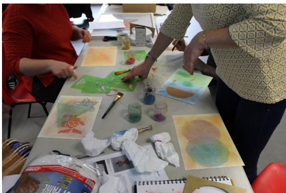
Atelier au pastel sec en poudre, chiffon, pochoir