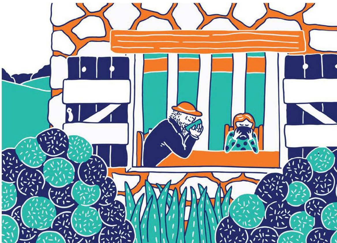
Claire Astigarraga & Sophie Dang Vu, détail du conte illustré Le Taureau Bleu , 2019