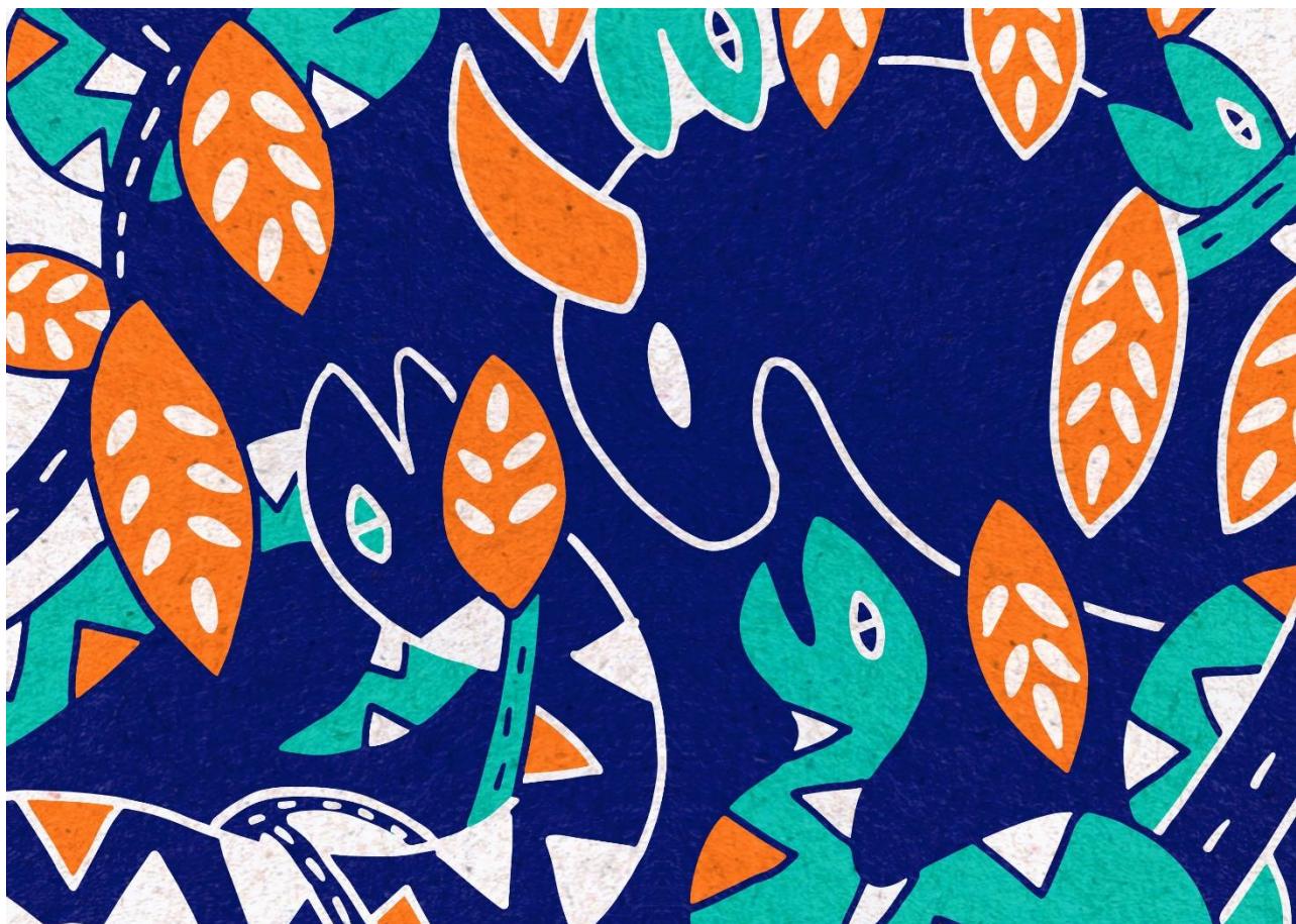
Claire Astigarraga et Sophie Dang Vu, Les feuilles de cuivre , détail du conte illustré Le Taureau Bleu , 2019

Vernissage le vendredi 6 septembre à 18h30