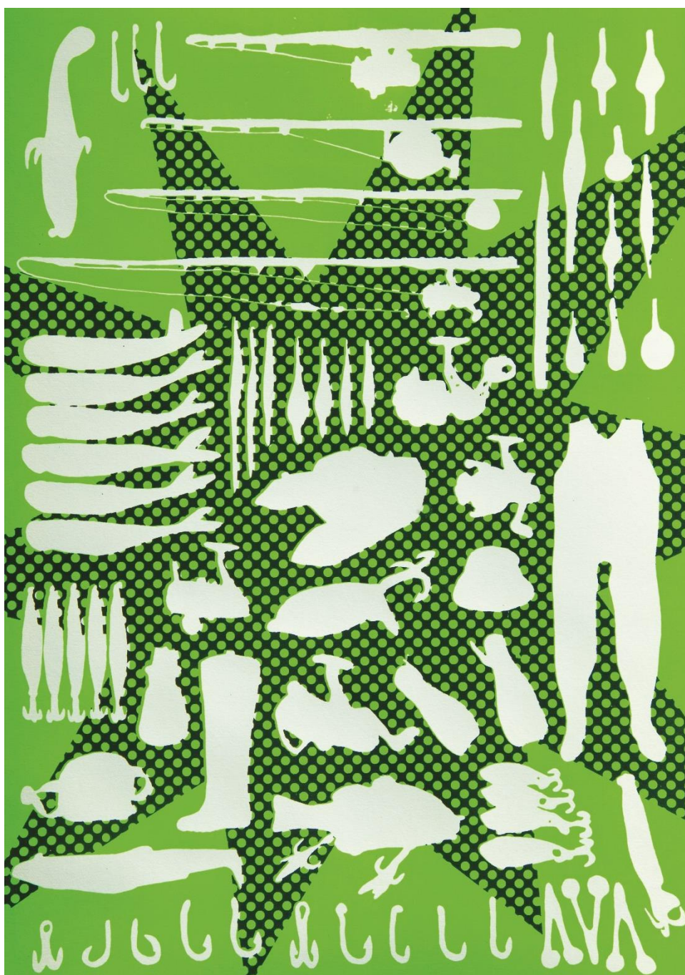
Cédric GUILLERMO, Les outils , 30 x 42 cm, sérigraphie fluo vert sur papier Canson, 2016.

Du lundi au vendredi de 13h30 à 17h30, fermé les jours fériés