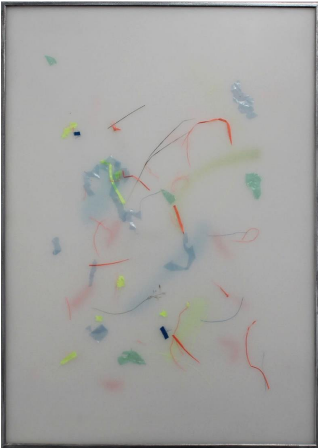
Sarah LÜCK, Herbes inutiles, voile de bateau, herbe séché, plastique de protection sous plexiglas , 50 cm x 70 cm, 2019. Collection du fonds d'art contemporain de Montfort Communauté.