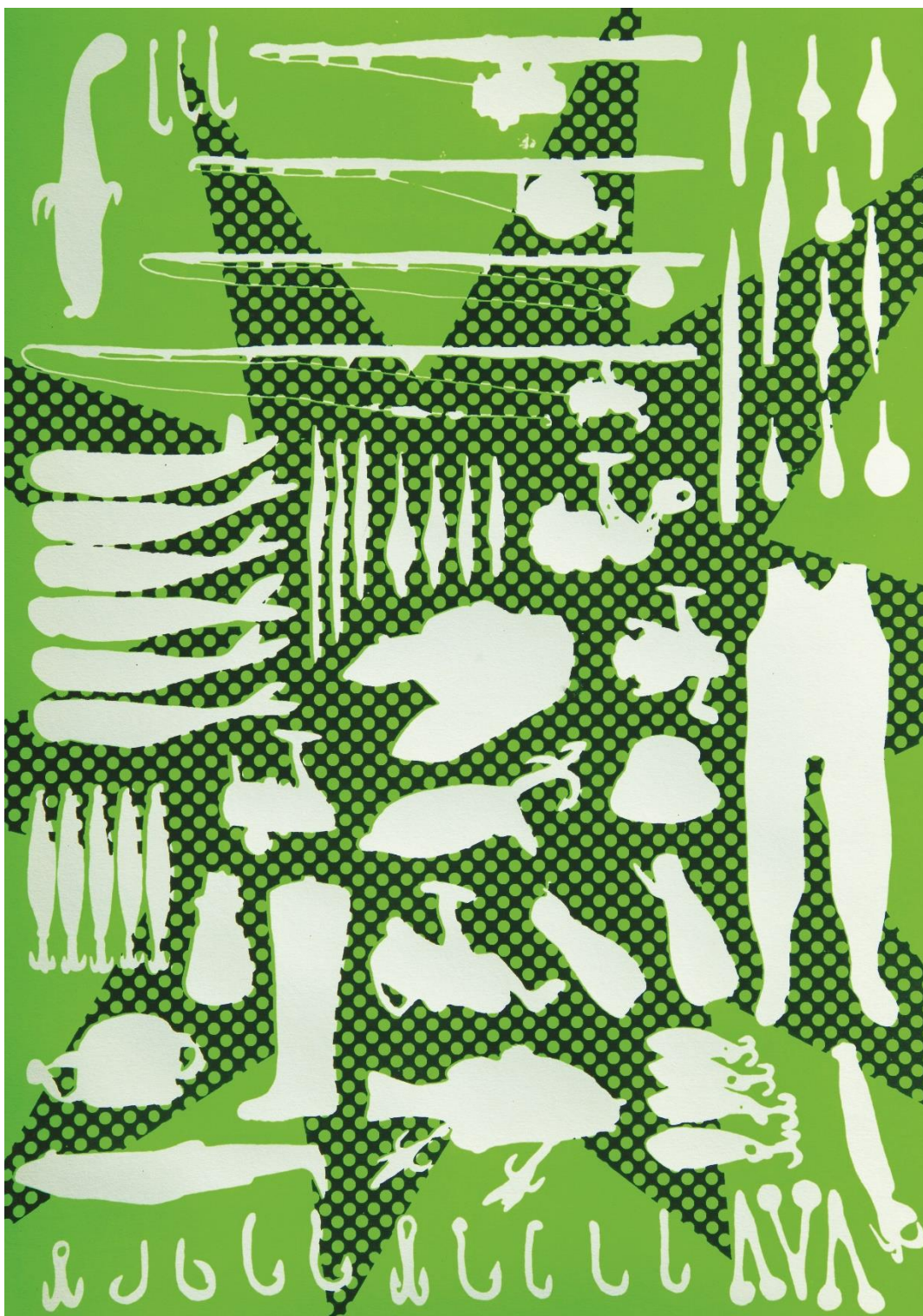
Cédric GUILLERMO, Les outils , 30 x 42 cm, sérigraphie fluo vert sur papier Canson, 2016. Collection du fonds d'art contemporain de Montfort Communauté.