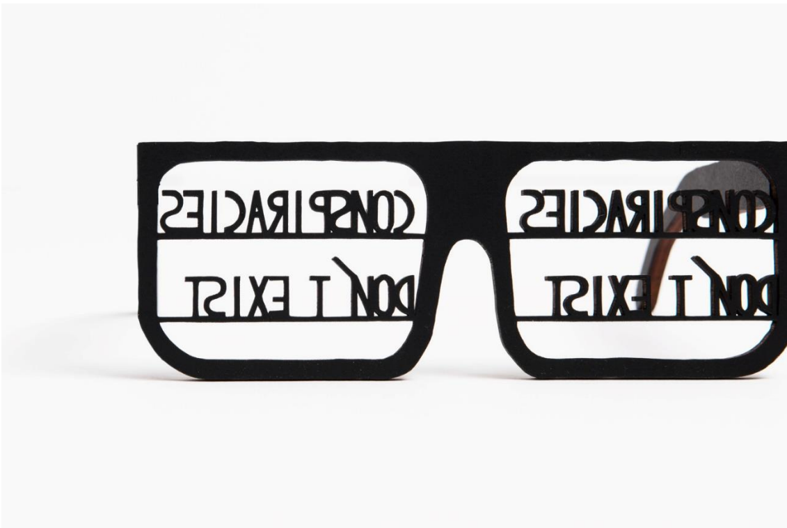
Olivier GARRAUD, Conspiracies don't exist , 13 x 15 x 12 cm, contreplaqué, encre, 2017. Collection du fonds d'art contemporain de Montfort Communauté.